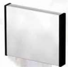
konzolos tábla (konzolos falsíkra merőleges tábla)