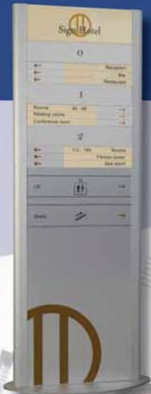
Összetett feliratozású Totem oszlop