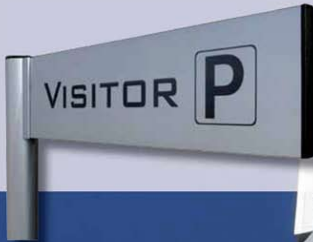
Egyszerű „zászlós” irányjelző oszlop