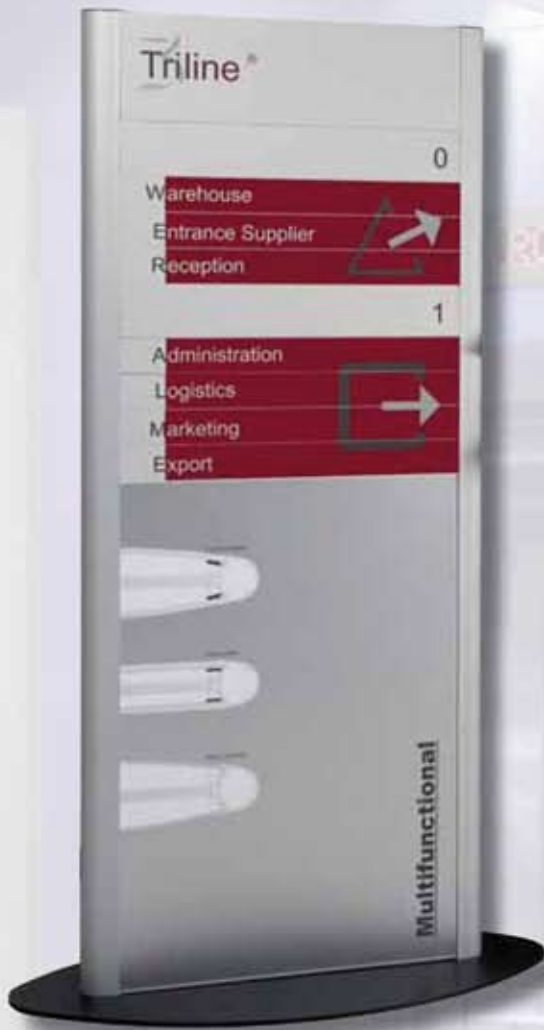
silk összetett totem oszlop