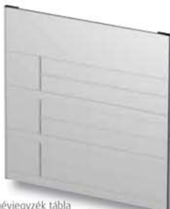
névjegyzék tábla (több név kiírására alkalmas összetett tábla)