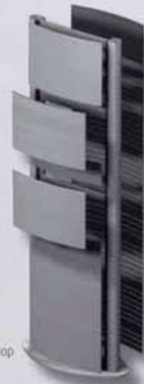
íves összetett totem oszlop