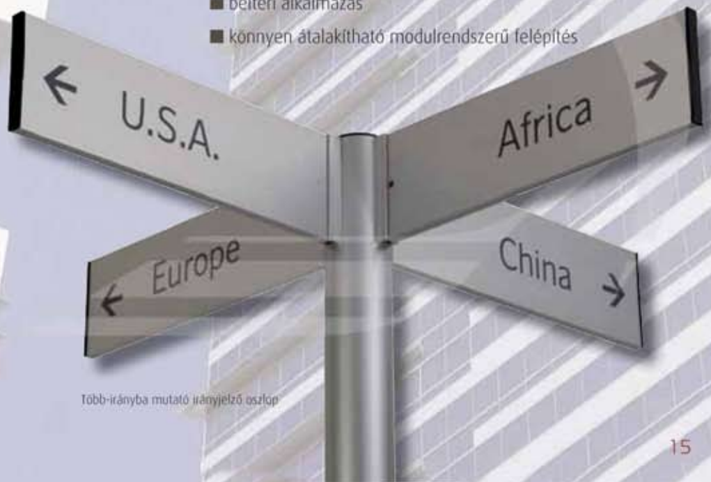
Több-irányba mutató irányjelző oszlop